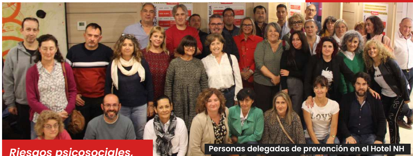
Personas delegadas de prevención en el Hotel NH

La Inspección de Trabajo no tiene medios suficientes para hacer cumplir la Ley de Prevención de Riesgos Laborales en las empresas, la Policía Laboral necesita recursos para evitar muertes y también accidentes graves