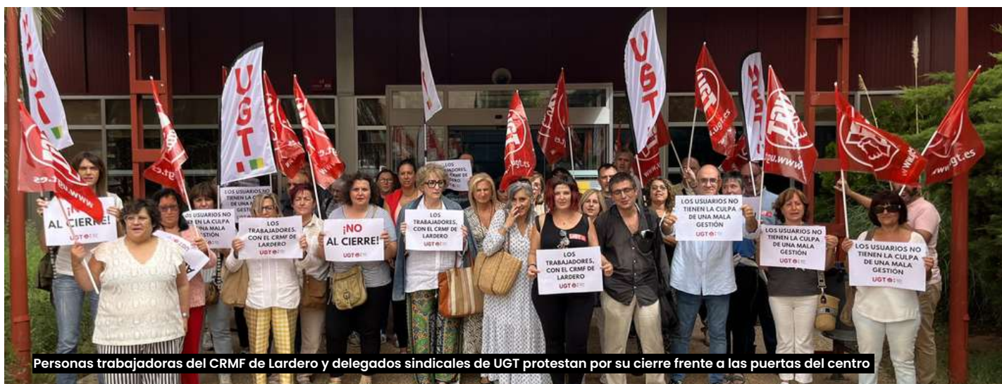
Personas trabajadoras del CRMF de Lardero y delegados sindicales de UGT protestan por su cierre frente a las puertas del centro